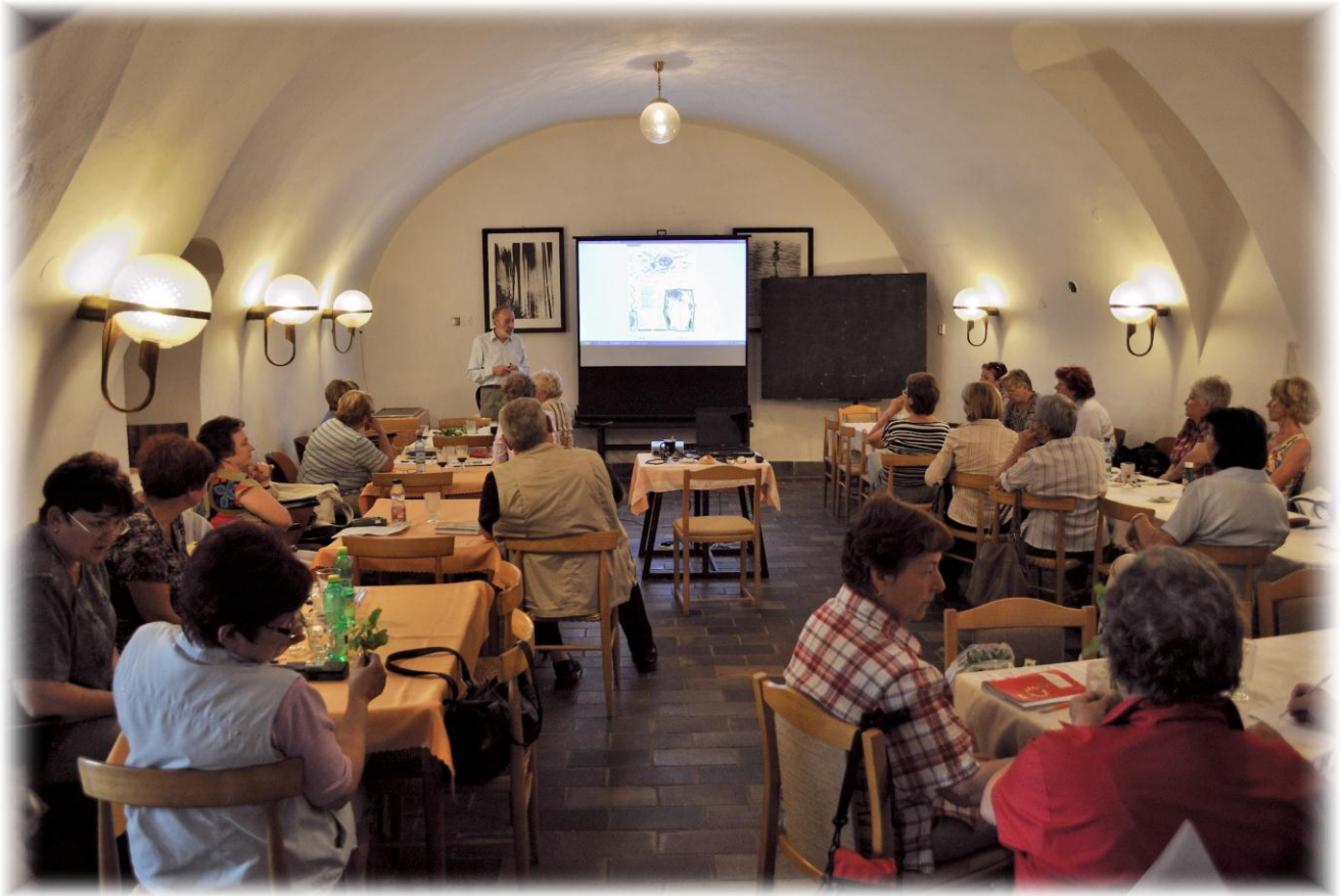
Přednáška v Zámeckém klubu, 2011